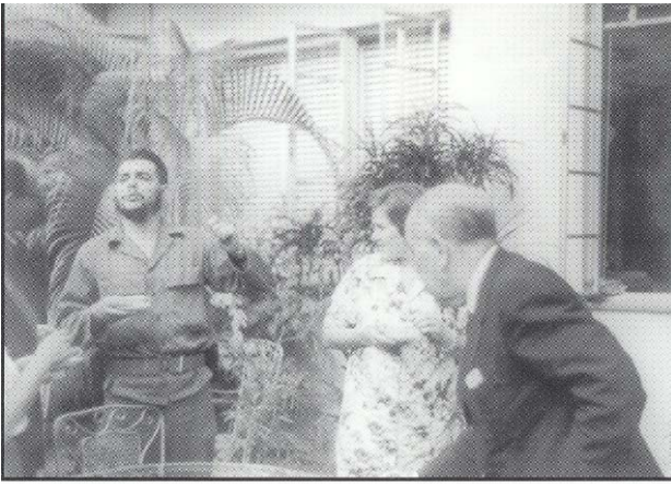
1962 · En La Habana, Cuba, con Ernesto "Che" Guevara.